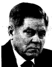
Вячеслав Михайлович Лебедев, Председатель Верховного Суда РФ

По словам Председателя ВС РФ, за последние 5 лет суды ежегодно освобождают от уголовной ответственности примерно четверть всех подсудимых. Число приговоренных к реальному сроку лишения свободы с 2006 по 2015 годы снизилось на 42% (с 312 тысяч до 219 тысяч человек). По данным ФСИН, количество людей в исправительных учреждениях с 2010 года снизилось на 25% (на 223 тысячи). В итоге за этот период ФСИН ликвидировала 36 исправительных и 35 воспитательных колоний. • с. 32